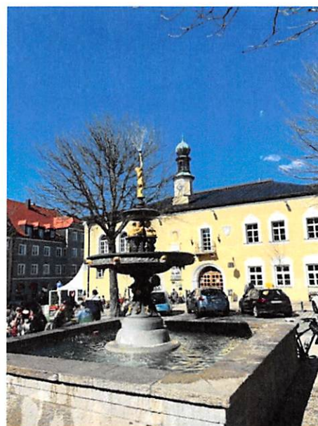
Marktbrunnen in Viechtach